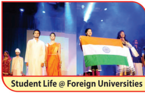
Student Life @ Foreign Universities